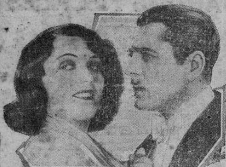
POLA NEGRI - WARNER BAXTER IN THE ROWLAND V. LEE PRODUCTION "THREE SINNERS" A PARAMOUNT PICTURE

La primera proyección de la bellísima super producción de la "Paramount" titulada TRES PECADORES, efectuada anoche ante una inmensa concurrencia en el teatro Raventós, constituyó un gran éxito, tal y como lo habíamos predicho.