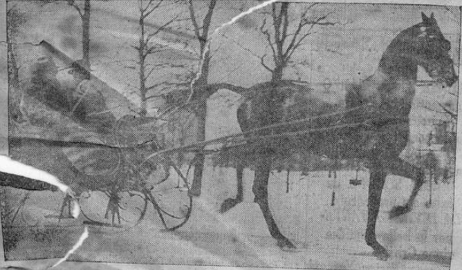
He aquí un aspecto del Parque Central de Nueva York, convertido por el encanto de la nieve en un escenario que recuerda un cuento ruso, con la atracción de sus trineos.