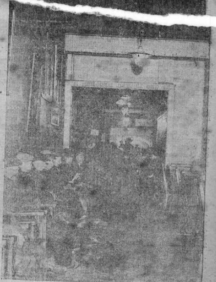
Huyendo del intenso frio que azota Chicago, este grupo de personas sin hogar encuentra asilo en los dispensarios del Ejército de Salvación.